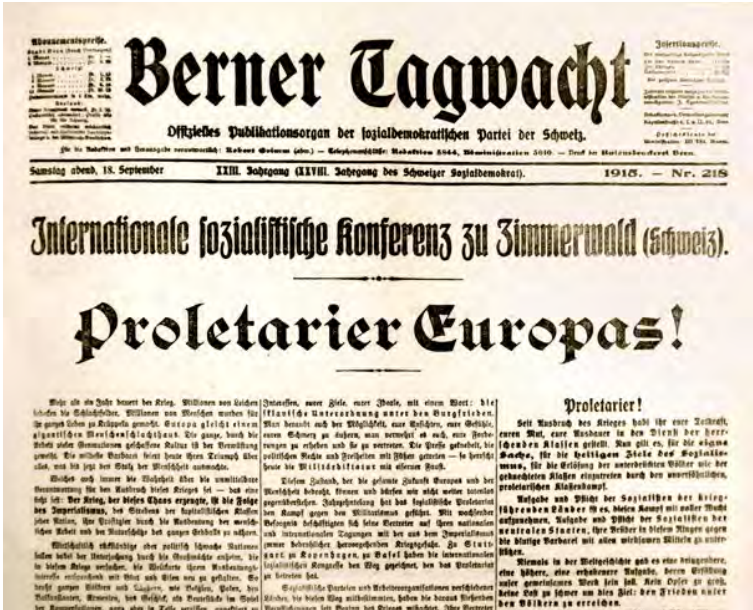
Der Bericht in der lokalen Zeitung der Sozialdemokraten