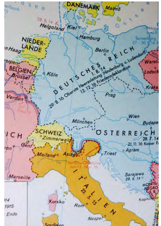
Zimmerwald im Zentrum der Schweiz: aus dem Deutschen Geschichtsatlas von damals